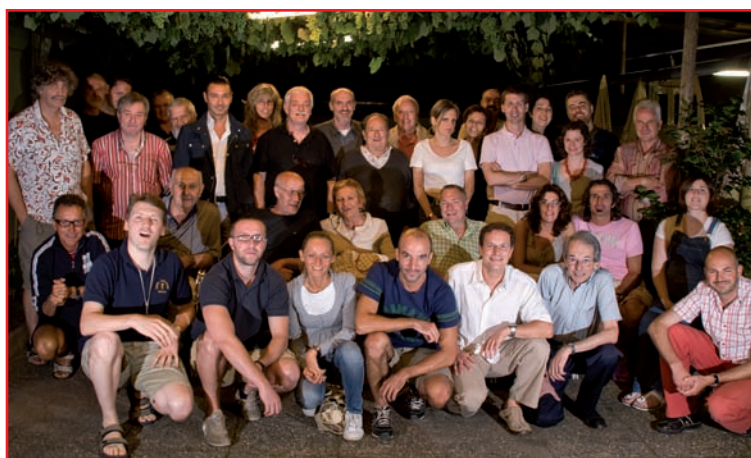
Soci FCCC estate 2009